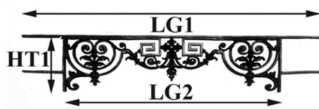
Schéma explicatif dimensionnel